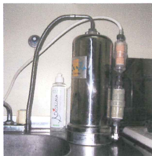
2段で取り付けられた様子