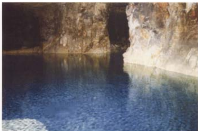
岡山県新見市金附山鉦山の洞窟