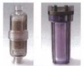
スーパーゼオプレフィルター 大型ゼオフィルター

ゼオライトをセラミック化した、放射性セシウム除去のためのフィルターです。 にいみ、にいみフルハウスに接続してご使用になります。