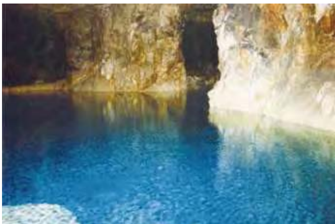
岡山県新見市金附山鉦山の洞窟