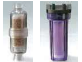
スーパーゼオプレフィルター 大型ゼオフィルター

ゼオライトをセラミック化した、放射性セシウム除去のためのフィルターです。 にいみ、にいみフルハウスに接続してご使用になれます。